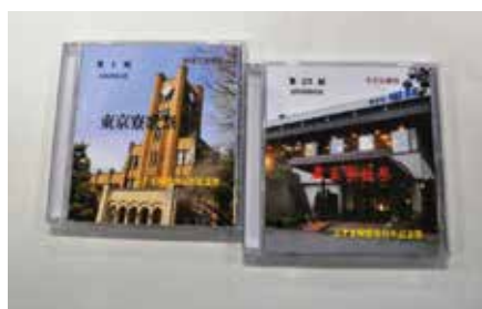
寮歌祭DVD作成 東京ふすま会