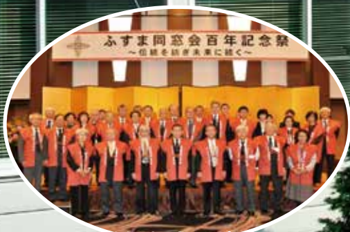
実行委員会メンバー