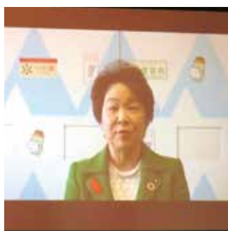
来賓祝辞：吉村美栄子山形県知事