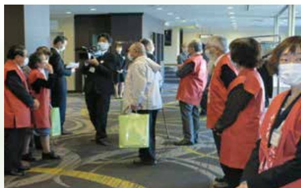
散会后 見送り風景