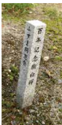
白樺の記念植樹（一例）：ふすまの碑前 他に、山寺、理学部中庭、同窓会館庭にも