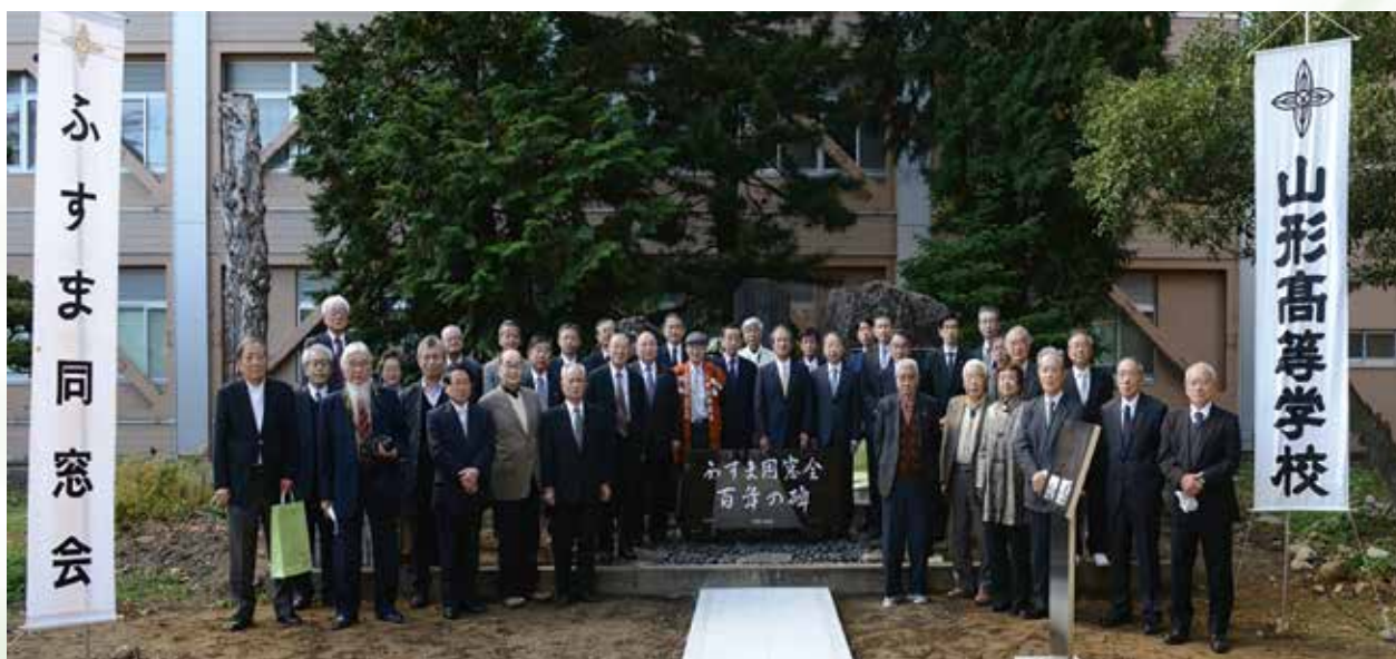
ふすま百年の碑建碑式 喜びを分かち合う参加者 2020.10.24