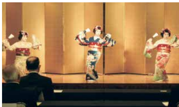
祝 舞：山形舞子 三番叟ほか