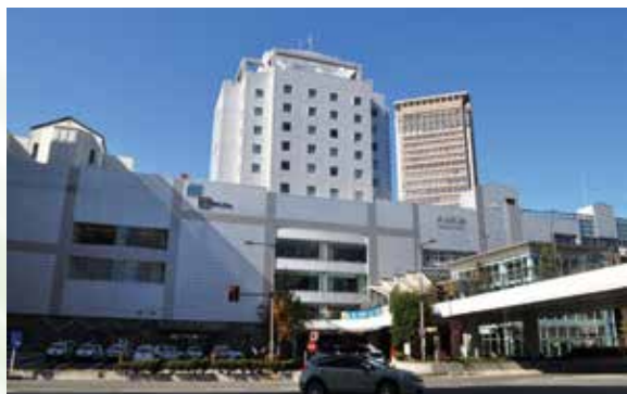
会場：ホテルメトロポリタン山形