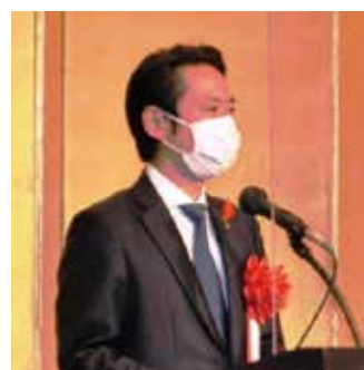
来賓祝辞：佐藤孝弘山形市長