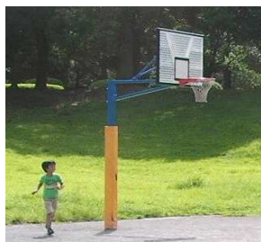
バスケットゴール