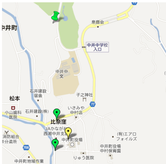
小田急線秦野駅北口 5番乗り場バス時刻表