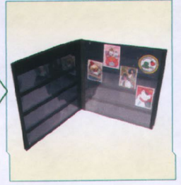
きれいに仕上がった切手を付属のファイルに収める

※別売りでエコスタンプ専用のファイルがあります ※尚、切手ののりが特殊の場合、はがれにくいことがあります