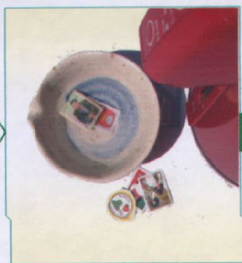
お茶碗などにポットのお湯を注ぎ、切手を数秒浸してはがす (この際、付属のピンセットを使う)