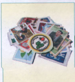
使用済記念切手を集める